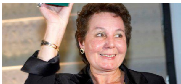
Parlement Européen, 2006 (Prix Silver Rose)

Le détail des questions ainsi qu'une synthèse des réponses obtenues dans plusieurs départements sont consultables sur notre site www.ellesaussi.org