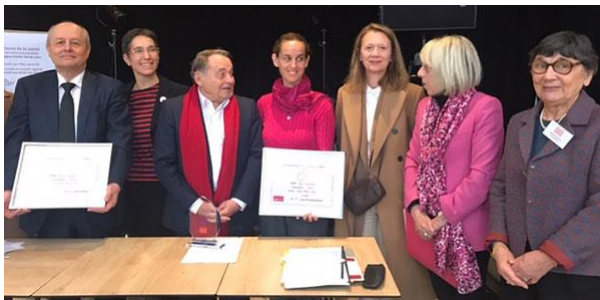
Le 11 mars à Châteauroux

Elles aussi 45 est toujours membre du groupe d'associations Forum des droits humains d'Orléans .