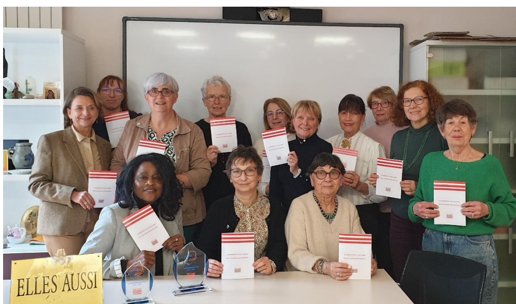
11 mars 2024 au siège de l'association