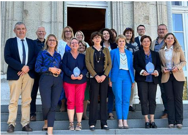
25 septembre à Bourg en Bresse

25 septembre 2023: Marianne de la Parité à Bourg-en-Bresse (Ain), en présence de Chantal Mauchet Préfète.