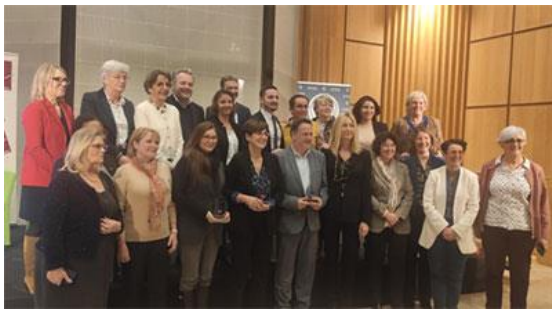
Le 4 janvier à Beauvais

03 janvier 2023 : Marianne de la parité à Saint-Quentin (Aisne)