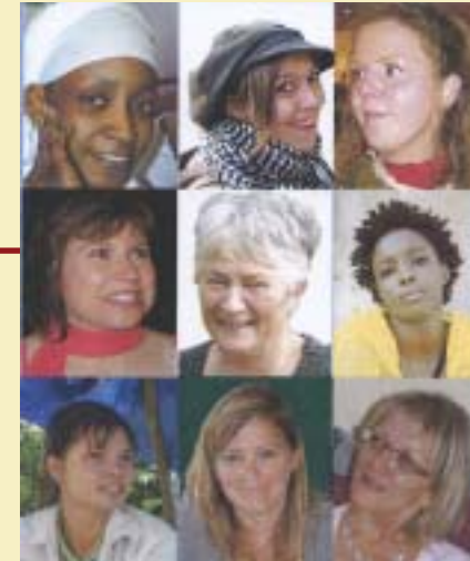
Associations membres d' Elles aussi :

Action Catholique Générale Féminine Alliance des Femmes pour la Démocratie Femmes d'Alsace Grain de Sel-Rencontres Rien sans elles (Finistère) Femmes et élues de la Manche UFCS-FR